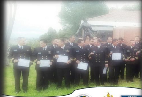
"SEMINARIO ESTRATEGIAS DE LEGALIDAD EN LA OPERACIONALIDAD DE LA ARMADA NACIONAL"