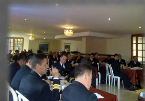
SEMINARIO "BUENAS PRACTICAS DEL PRIMER RESPONDIENTE EN OPERACIONES CONTRA EL NARCOTRAFICO DE LA ARMADA NACIONAL" ESCUELA SUPERIOR DE GUERRA BOGOTA-COLOMBIA MARZO 2013