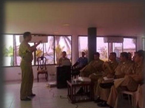
SEMINARIO "BUENAS PRACTICAS DEL PRIMER RESPONDIENTE EN OPERACIONES CONTRA EL NARCOTRAFICO DE LA ARMADA NACIONAL" GUARDACOSTAS DEL CARIBE BUE NAVANTURBA-COLOMBIA FEBRERO 2013