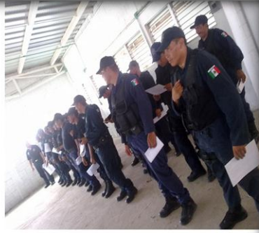
CURSO INTERNACIONAL Curso *Operaciones Policiales de intervención contra la Delincuencia Organizada