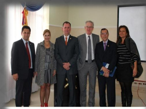
Seminario "Democracia, Estado y Delincuencia Organizada en México" Bogotá. Colombia-Abril 05 del 2013