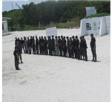
CURSO INTERNACIONAL Curso *Operaciones Policiales de intervención contra la Delincuencia Organizada