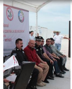
CURSO INTERNACIONAL Curso *Operaciones Policiales de intervención contra la Delincuencia Organizada