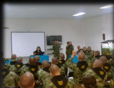
Seminario Taller "Estrategias de Legalidad en la Operacionalidad de la Armada Nacional" Escuela De Combate Fluvial. Puerto Leguizamo. Putumayo Junio 2013