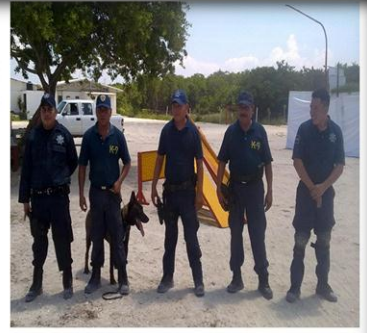
CURSO INTERNACIONAL Curso *Operaciones Policiales de intervención contra la Delincuencia Organizada