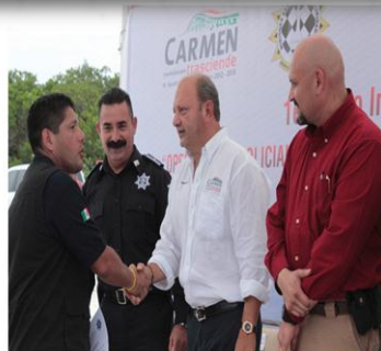
CURSO INTERNACIONAL Curso *Operaciones Policiales de intervención contra la Delincuencia Organizada