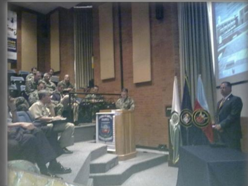
Conversatorio "Génesis de la Delincuencia Organizada en México" Escuela Superior de Guerra Bogotá. Colombia-Abril 05 del 2013