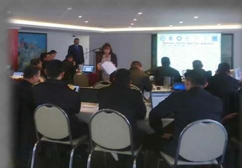
SEMINARIO "BUENAS PRACTICAS DEL PRIMER RESPONDIENTE EN OPERACIONES CONTRA EL NARCOTRAFICO DE LA ARMADA NACIONAL" ESCUELA SUPERIOR DE GUERRA BOGOTA-COLOMBIA MARZO 2013