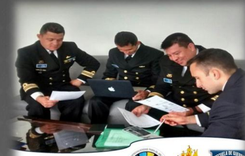
"SEMINARIO ESTRATEGIAS DE LEGALIDAD EN LA OPERACIONALIDAD DE LA ARMADA NACIONAL"