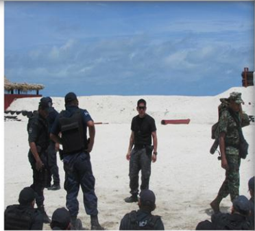
CURSO INTERNACIONAL Curso *Operaciones Policiales de intervención contra la Delincuencia Organizada