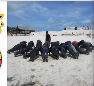
CURSO INTERNACIONAL Curso *Operaciones Policiales de intervención contra la Delincuencia Organizada