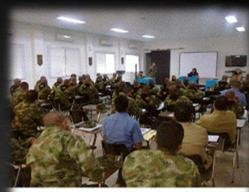
Seminario Taller "Estrategias de Legalidad en la Operacionalidad de la Armada Nacional" Escuela De Combate Fluvial. Puerto Leguizamo. Putumayo Junio 2013