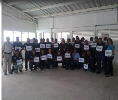
CURSO INTERNACIONAL Curso *Operaciones Policiales de intervención contra la Delincuencia Organizada