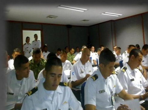
SEMINARIO "BUENAS PRACTICAS DEL PRIMER RESPONDIENTE EN OPERACIONES CONTRA EL NARCOTRAFICO DE LA ARMADA NACIONAL" GUARDACOSTAS DEL CARIBE CARTAGENA-COLOMBIA FEBRERO 2013