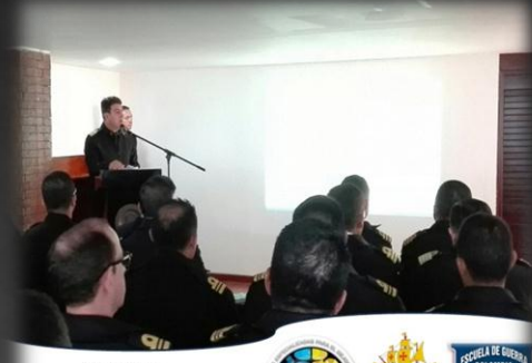
"SEMINARIO ESTRATEGIAS DE LEGALIDAD EN LA OPERACIONALIDAD DE LA ARMADA NACIONAL"