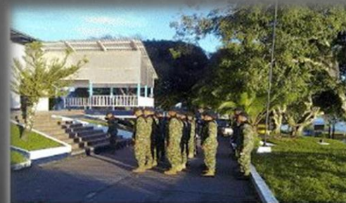
Seminario Taller "Estrategias de Legalidad en la Operacionalidad de la Armada Nacional" Escuela De Combate Fluvial, Puerto Leguizamón - Putumayo